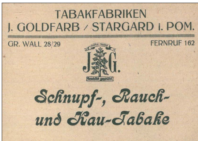
Ryc. 3. Najstarszy znany inzerat reklamowy firmy J. Goldfarb ze Stargardu (wg Adressbuch 1921)