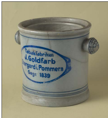
Ryc 7. i 8. Naczynie na tytoń do żucia firmy J. Goldfarb ze Stargardu. Zbiory MAH w Stargardzie, nr inwent. MS/S/1298.