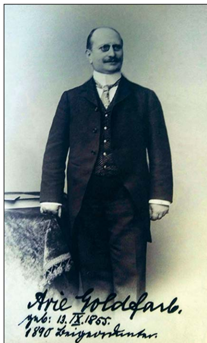
Ryc. 2. Arie Goldfarb (1855–1925), kolejny właściciel fabryki Goldfarba.