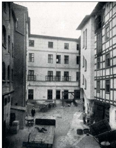
Ryc. 4. i 5. Siedziba firmy przy Grosser Wall (obecnie ul. Bolesława Chrobrego) w Stargardzie od frontu i zaplecza (wg Schröer 1922)