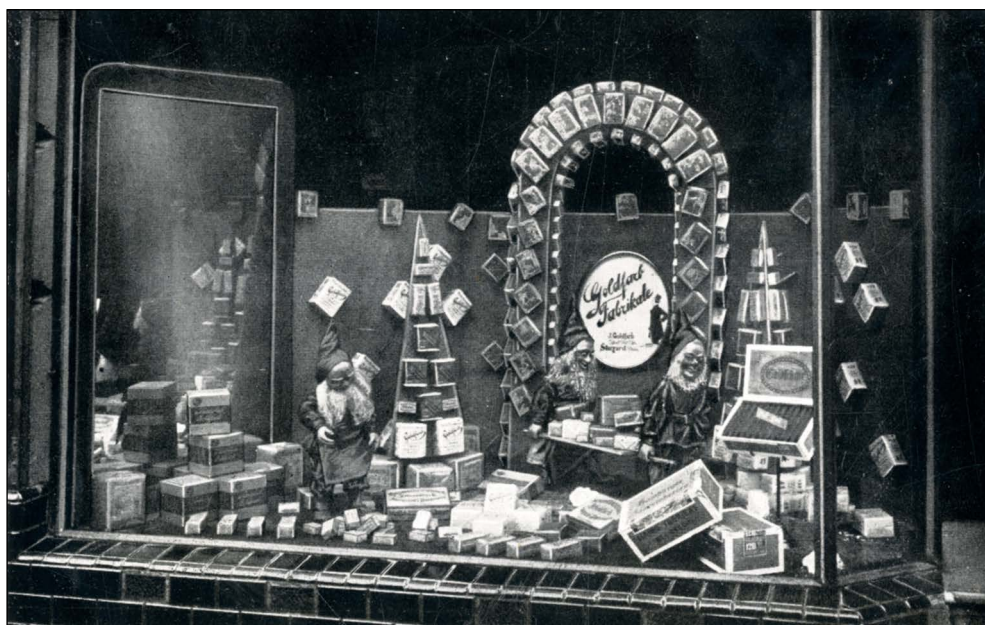
Ryc. 6. Witryna sklepu tytoniowego z wyrobami Goldfarba, Stargard i Pom., Holzmarktstrasse (obecnie ul. Władysława Łokietka) (wg Schröer 1922)